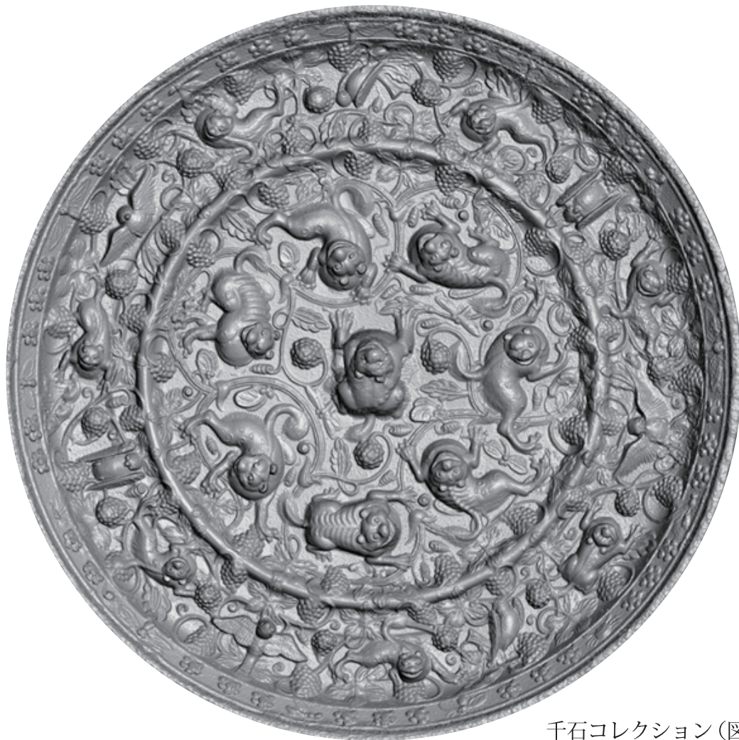
千石コレクション(図録213)