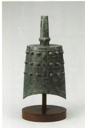
しょう 鐘 (春秋戦国)