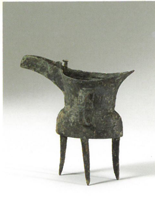
しゃく 罍 (商)