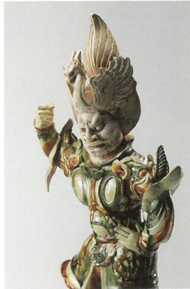
さんさいてんのうよう 三彩天王俑 (唐)

新展示室が完成し、古代鏡展示館は令和3年春、新たに生まれ変わりました。2倍に広くなった展示空間で、3つの展示をお楽しみください。