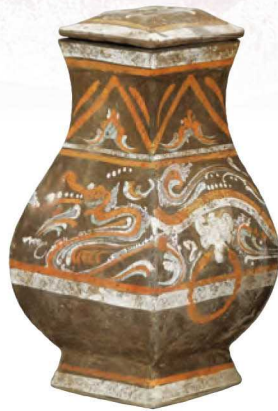
灰陶加彩龍紋紡(漢)