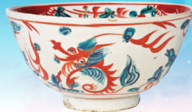
左) 褐釉博山酒尊 / 後漢時代 / 当館蔵 中) 瑞獸龍鳳紋鏡 / 唐時代 / 当館蔵 右) 呉州赤絵写影手鉢(琅平焼) / 江戸時代後期～明治時代前期 / 兵庫陶芸美術館蔵(田中寛コレクション) (展示6/1～9/10)