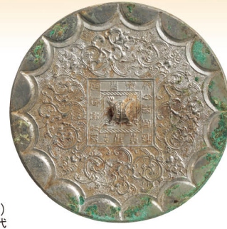
蟠龍紋鏡 前漢時代