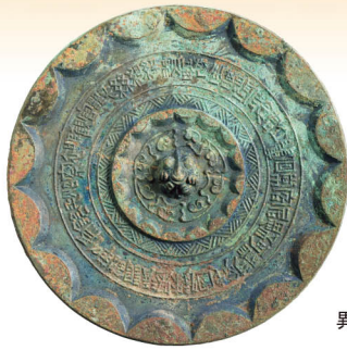
重列式神獸鏡 後漢時代