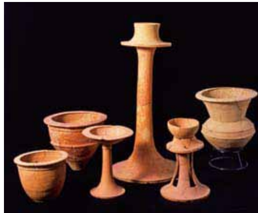
祭祀土器(佐賀県吉野ヶ里遺跡)佐賀県蔵

金属の技術革新が生活を豊かにしました。そしてムラからクニ、そして世界へと、私たちはさまざまな人々と関わる社会の中で生活をしています。