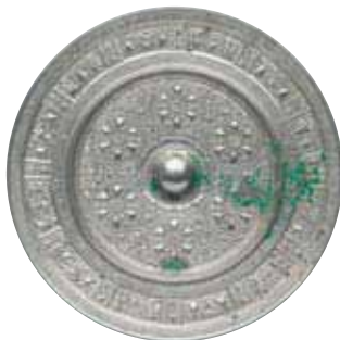
だんかもんきょう 団華紋鏡【隋—唐】