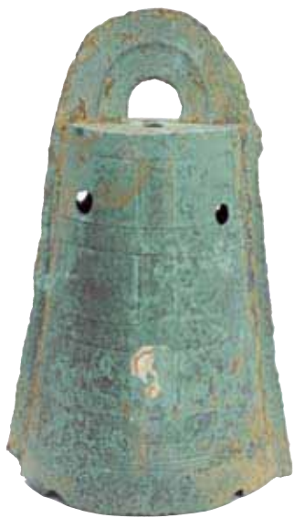
望塚銅鐸(加古川市)兵庫県立考古博物館蔵

みなさんが「弥生時代」と聞いて思い浮かぶのは、小学校で習った米作りや竪穴住居でしょうか。弥生時代は、水田稲作の開始とともに始まったとされています。近年、最古の水田に伴う弥生土器に付着したススなどで年代測定を行った結果、紀元前10世紀まで遡るという研究結果が出ました。それまで考えられていた年代より500年以上さかのぼり、弥生時代は1000年以上の長い時代であったと考えられています。