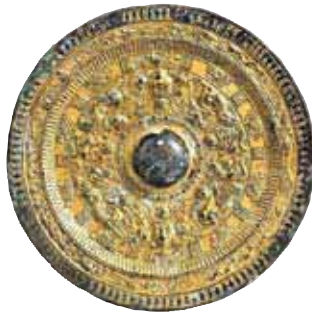
とくたいちしきしんじゅうきょう 鍍金対置式神獸鏡【後漢】