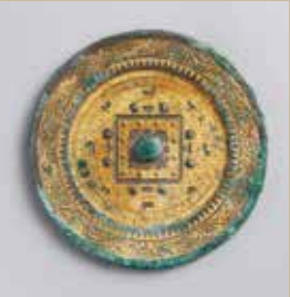
鍍金方格規矩四神鏡（当館蔵）

古来より鏡は神秘的な力を有し、その恩恵を所有者にもたらすと考えられていました。裏面には神秘的な力を表現した図像や、願いが叶うことを保証する銘文が記されています。 本展ではコレクションの中から方格規矩四神鏡や八花鏡など前漢～唐の時代の鏡を展示します。 長寿や立身出世、家族の幸福など、古代中国の人々が願いそして鏡に託した想いに触れてください。