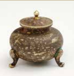
銀鍍金禽獣草花紋鍍（ふく） 【高さ：5.9cm、腹径：6.0cm】

大唐王朝の都・長安から発見される金銀器は、絢爛たる貴族社会を背景に卓越した工芸技術と異国情緒豊かな感性が融合した「美の集積」です。 唐建国1,400年を迎えた本年、唐文化の粋を集めた金銀器や銅鏡によって、遥かなる長安の繁栄と栄華が甦ります。