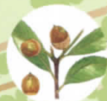
どんぐりであそぼう