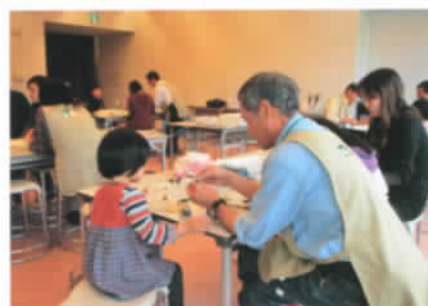
どんぐりを工夫して