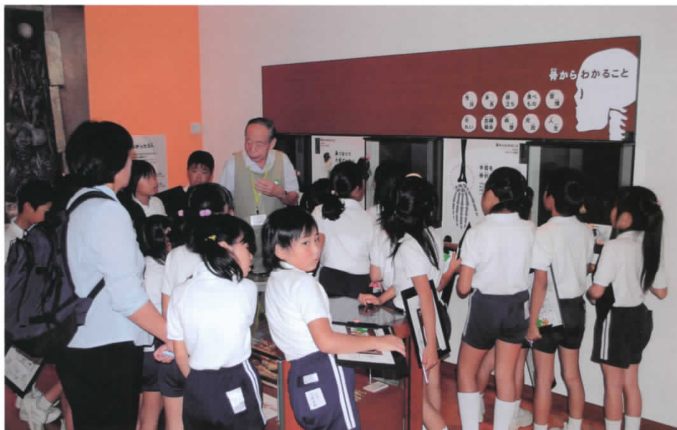
ボランティアによる展示解説のようす