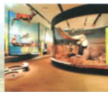
③ 実物大のジオラマ