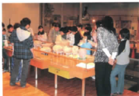
遺跡から掘り出されたものは？