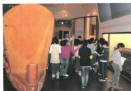
古代船但馬に現る