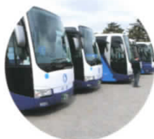
バス専用 (無料 予約要 10台)