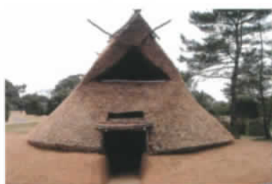
竪穴住居(車椅子対応)