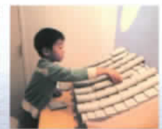
⑥ 屋根をふいてみる