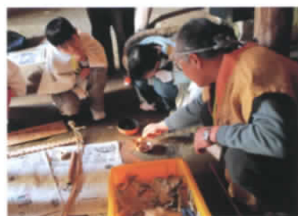
竪穴住居で火起こし

復元された竪穴住居。中に入ってみると弥生人の話し声が聞こえてきそう。古代服を着て寝てみたり、火を起こしてみたり…。また、弓矢体験を行うこともできます。スタンプラリー・お楽しみ会など、工夫次第で楽しい一日を過ごせますよ。