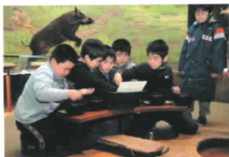
縄文人の主食・どんぐり