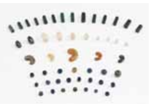
南構古墳群出土 玉類(当館蔵)

兵庫県教育委員会が令和4年度に実施した発掘調査と出土品調査の成果を一堂に公開する速報展です。併せて、県内各地から出土した県指定文化財を展示し、地域色豊かな兵庫五国の姿を紹介します。