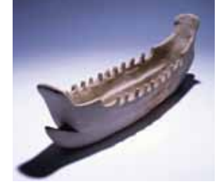
池田古墳出土 船形埴輪(重要文化財 当館蔵)

前方後円墳に代表される古墳が盛んに造られた3世紀中ごろから6世紀終わりまでの約350年間の古墳時代、古墳の形態や副葬品などは時期や地域の違いにより変化しました。また、人々の