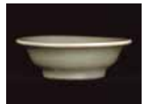
福田片岡遺跡出土 青磁皿(当館蔵)

たつの市に所在する福田片岡遺跡は、発掘調査の結果、中世の居館跡や中世山陽道(筑紫大道)が見つかり、損保川と中世山陽道が交わるという交通の要衝に位置するため、多彩な陶磁器類が出土しました。これらの出土品から、中世の人や物の交流の一端を紹介します。