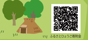
ふるさとひょうご寄附金