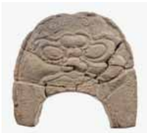
辻ヶ内遺跡出土 鬼瓦(当館蔵)

本展では、県内および山陽道各地の調査事例をもとに、古代の交通インフラの実態を紹介します。