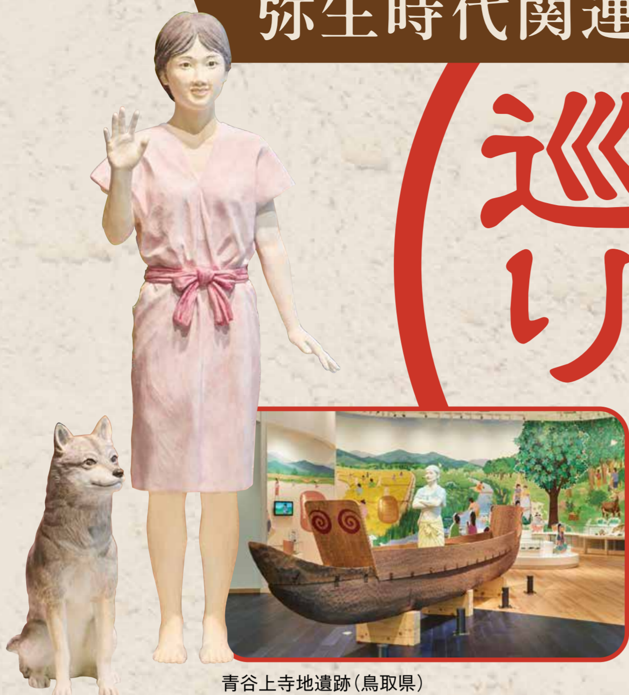
青谷上寺地遺跡(鳥取県)