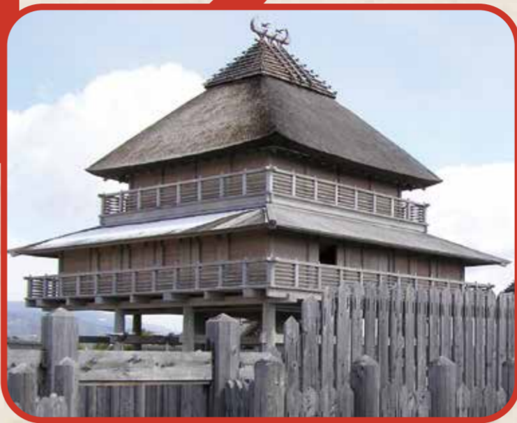
吉野ヶ里遺跡(佐賀県)