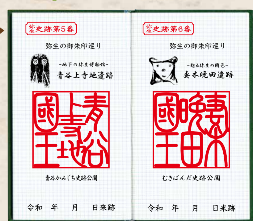
野帳(測量野帳)押印イメージ

※1ページ縦15.5cm、横9cm以上のメモ帳・ノートなどをご用意ください。御朱印帳に押印をご希望の方は、社寺等の御朱印帳とは別のものをご使用ください。社寺等によっては、弥生の御朱印を押印された御朱印帳には押印をお断りされることがあります。野帳とは、主に調査・測量等において、技師等が使用する手帳です。