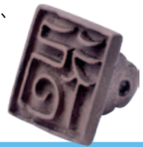
袴狭遺跡出土 銅印(当館蔵)

袴狭遺跡(はかせいせき・豊岡市)は昭和62年から平成7年までの間に、14次にわたって発掘調査が行われ、官衙、祭祀、生産など古代但馬国に関わる重要な成果が数多く発見されました。特に出土した大量の木製品は、多くの事を語ってくれます。奈良・平安時代を中心に近隣の砂入遺跡や荒木遺跡などの調査成果も含め、但馬地域を代表する遺跡の一つである袴狭遺跡の全貌に迫ります。