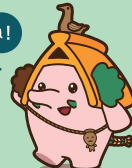
当館マスコットキャラクター ぼったん